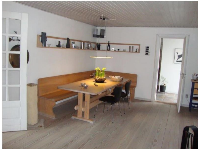
Ventehjørnet i køkken/alrummet